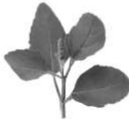
Tulasi dala (hojas de Oscimum sanctum )

Igualmente está el tulasi dala ( Oscimum sanctum ) en el que las hojas están en pares, en ángulos rectos. Se utilizan para el culto a las deidades. Es creencia general que Narayana se complace profundamente cuando se le ofrece un “tulasi dala” (una ramita de 4 hojas). Narayana o Vishnu o Vasudeva o Krishna son venerados generalmente con una unidad de 4 hojas de tulasi, que es una planta sagrada.