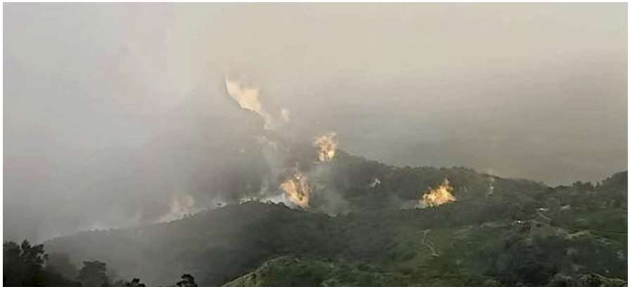
Fires at Master Mountain, Nilagiris