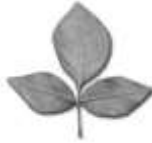
Bilwa dala (hojas de bael)

Existen hojas de árboles y de plantas con hojas triples y dobles que se pueden ordenar como los lotos mencionados para poder comprenderlo adecuadamente. En los rituales védicos esas hojas se utilizan para el culto. Está el bilwa dala (hojas de bael) que tiene 3 hojas que forman una hoja única.