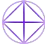
Imagen compuesta por Ludger Philips.

Dr. K. Parvathi Kumar: OM Namō Narayanaya.